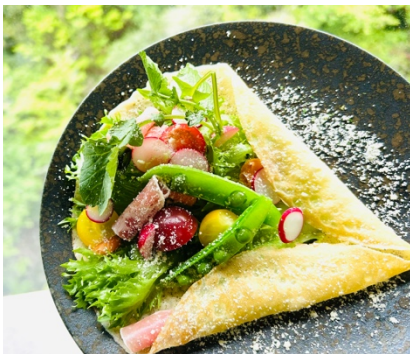
花束ブーケ仕立てのサラダ