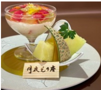
エディブルフラワー・デザート