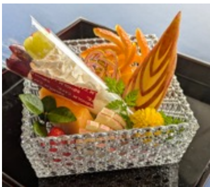
ブーケ風デザートプレート