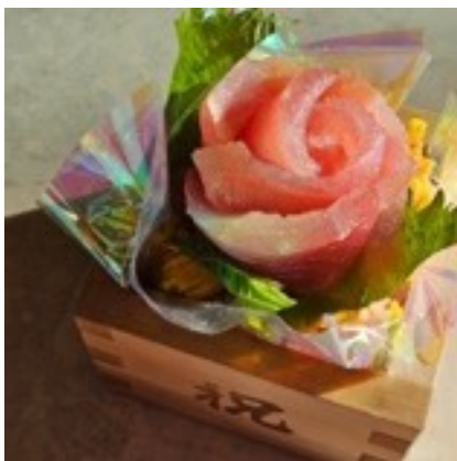
升のお寿司ブーケ