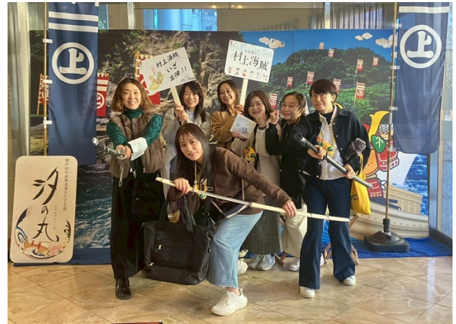
今治の宿「汐の丸」にて