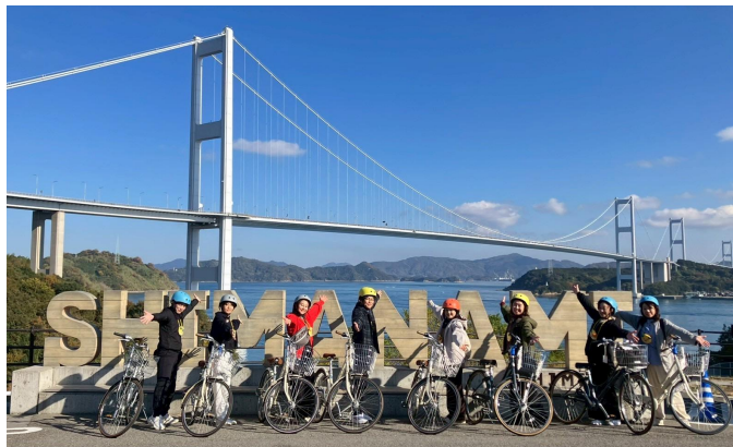
瀬戸内しまなみ海道にて