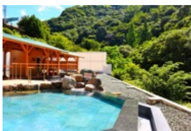
西日本最大級の露天風呂