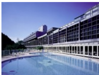
奥道後 壱湯の守 外観