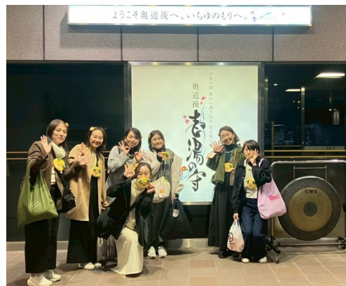
松山の宿「奥道後 壺湯の守」にて