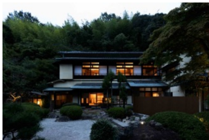
「奥道後 壺湯の守」歴史的建築の一例(坪中川)