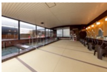
畳敷の温泉大浴場