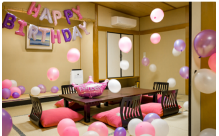
バルーンでお部屋を飾り付け