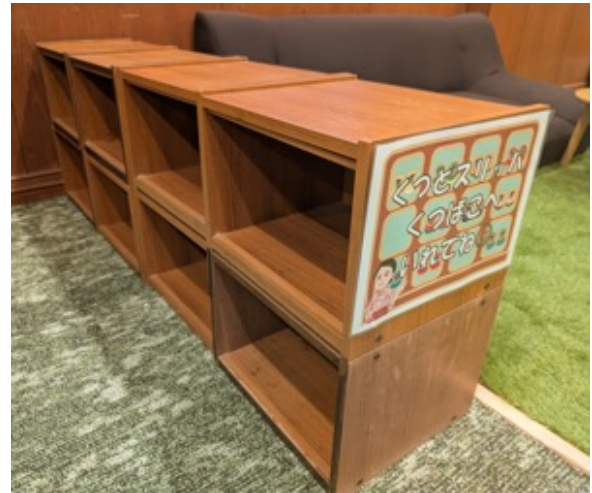
廃材を利用した「靴箱」