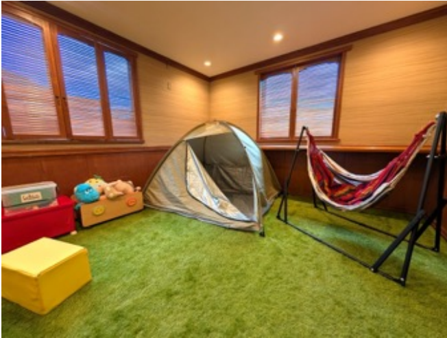
屋内キッズグランピング

このほどのキッズルーム「しゃくなげ」リニューアルでは、 環境への配慮と子どもの学びを重視した取り組み として、キッズスペースに 廃材を利用した「靴箱」 を設置しました。この靴箱は、土足禁止の芝生スペースを設けることで、靴を脱ぎ片付ける習慣を身につけるだけでなく、衛生面でも安心・安全な環境を提供しています。また、夕食後(20:30～21:00)には消灯をしてキッズスペース内にて 天井に浮かび上がる「屋内プラネタリウム」 の演出を実施します。山の中の旅館ならではの屋内キッズグランピングをイメージした空間となります。