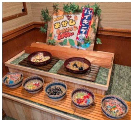
おかしバイキング(無料)