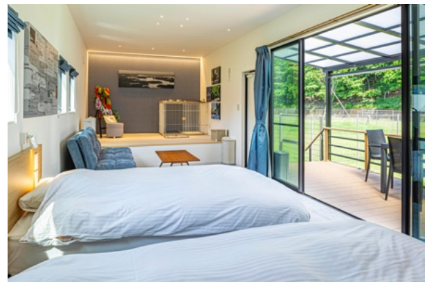
お部屋に愛犬のスペース