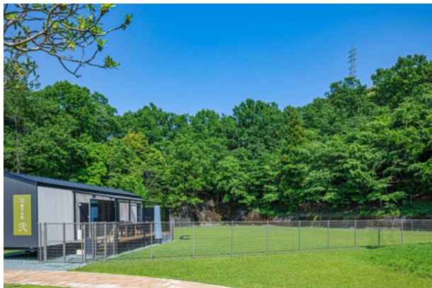
専用ドックラン付き