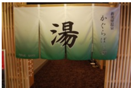
大浴場「かぐらばの湯」入口