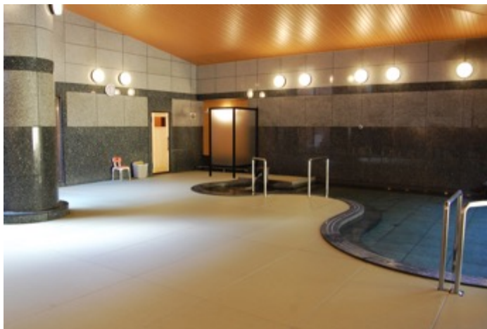
内風呂の洗い場に敷き詰めた「畳風呂」

「千の杜」には、64,000坪を有する敷地に、「斎王の宮」「月夜見の座」「Luxury Trailers 離宮伊勢」と4施設の宿泊施設があります。それぞれの施設をご利用のお客様のほか、伊勢神宮をはじめとした観光でお立ち寄りいただけるよう日帰り入浴でも「かぐらばの湯」をご利用いただけます。