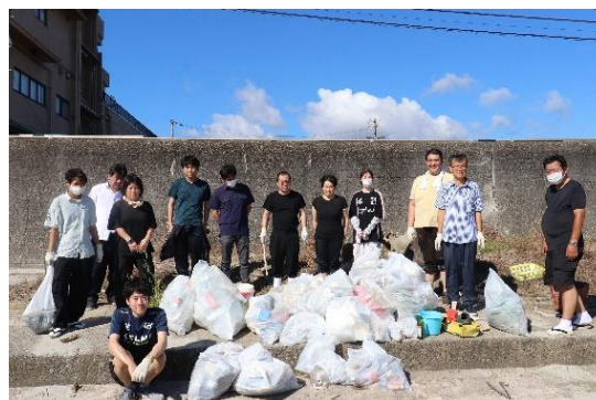
清掃活動のご参考(スタッフによる)