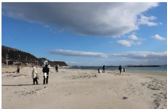
源氏香の前の山海海岸

海栄 RYOKANS は、「SDGs14.海の豊かさを守ろう」により地域の環境保全と美化への貢献を目指し、2021年1月より、休館日を利用して清掃活動を実施しています。源氏香は、宿の前の山海海岸を美しく保つため、このほど、通年で海辺の清掃を体験いただくことで宿泊料金の10%割引を適応する「SDGs 活動宿泊プラン」を企画しました。