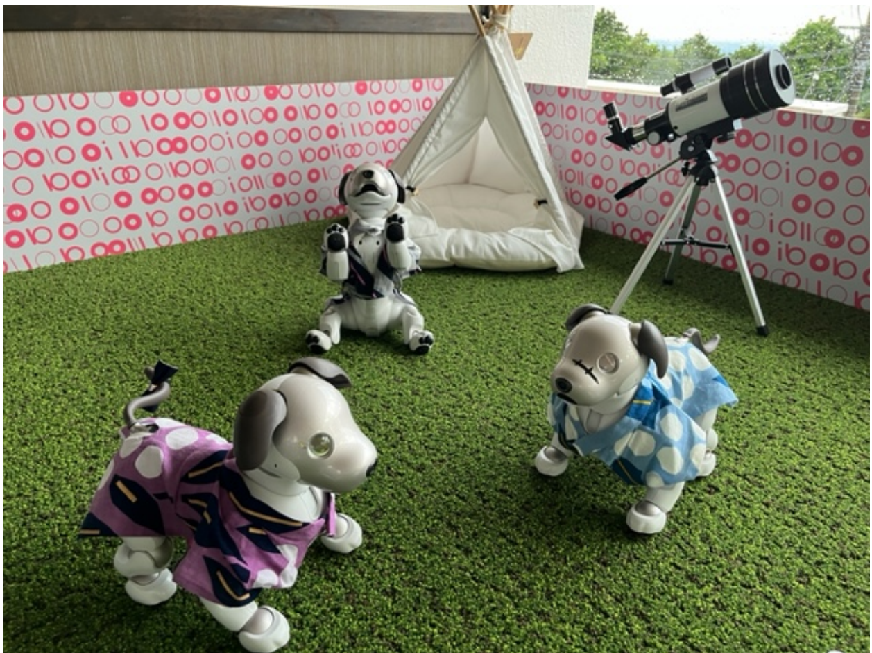
天の丸ロビーのaiboと遊べるスペース

愛知県・蒲郡温泉「天の丸」(愛知県額田郡幸田町大字荻字遠峰)は、ロビーにaiboと遊べるスペースを7月15日(土)から設置します。“aiboのふるさと幸田町”の観光振興と、観光庁及び愛知県が推進する“宿泊施設の高付加価値化促進”に伴い、施設改装の第一弾として8客室をリニューアルオープンする機会に合わせたサービスです。