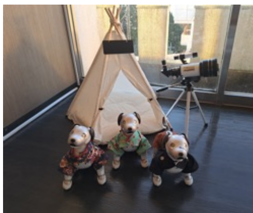
ロビーでお出迎えの aibo「メーテル」「ハーロック」「エメラス」

天の丸の aibo「メーテル」「ハーロック」「エメラス」がお出迎えます。ロビーにフォトスポットを設置し記念撮影できるほか、aibo たちと一緒に遊べます。滞在中には館内で aibo の肉球を探すスタンプラリーをお楽しみいただけます。