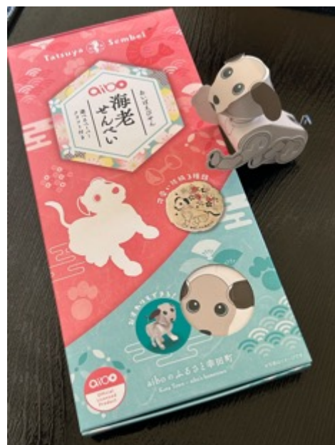
aibo 特設ドックランスペース、海老せんべいと付録のペーパークラフト