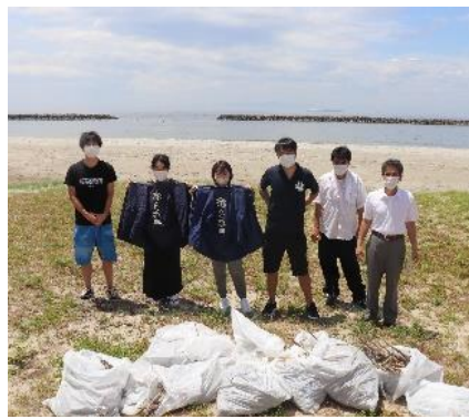
清掃活動のご参考(スタッフによる)