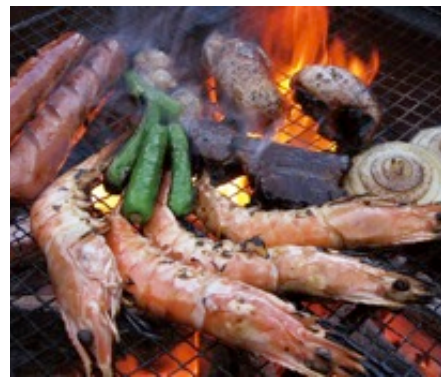
バーベキュー(イメージ)