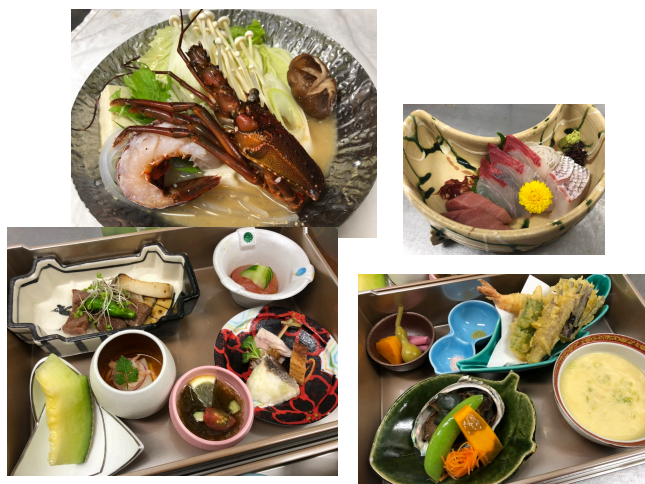
↑ 夕食お重膳イメージ

※海栄 RYOKANS グループは、9項目の行動指針を策定し3密回避対応に努めます。