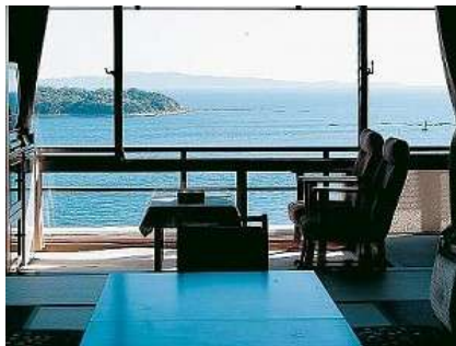
海が望めるお部屋