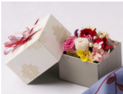
プリザーブドフラワー