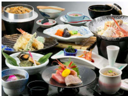
『夕波の膳』八丁味噌仕立ての海鮮鍋 など