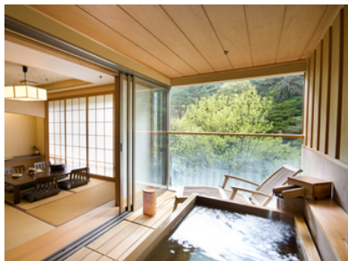
展望露天風呂付客室(洋室)