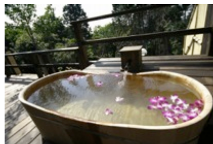
お部屋の露天風呂