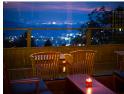
お部屋からの景色