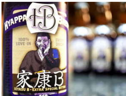
西浦の地ビール「家康ビール」