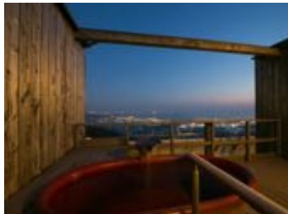
貸切露天風呂からの夜景