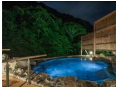
ライトアップされた露天風呂