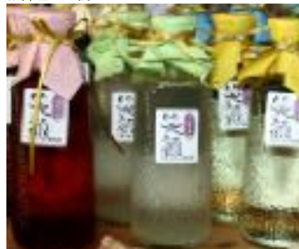
女将の会が開発したリキュール「笑顔」