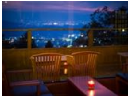
お部屋からの景色