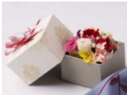
プリザーブドフラワー