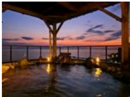
夕日の見える露天風呂