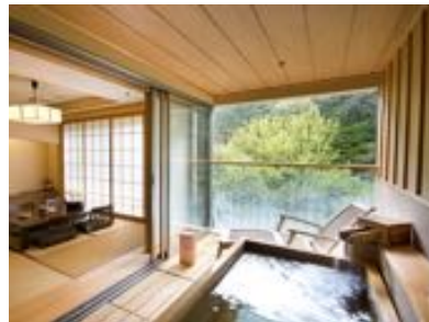
展望露天風呂付客室(洋室)