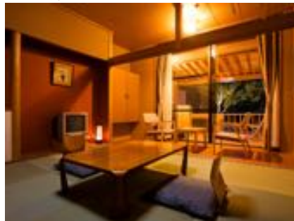
露天風呂付きお部屋