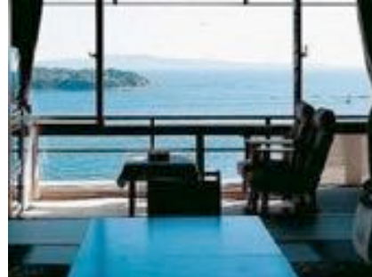
海が見えるお部屋