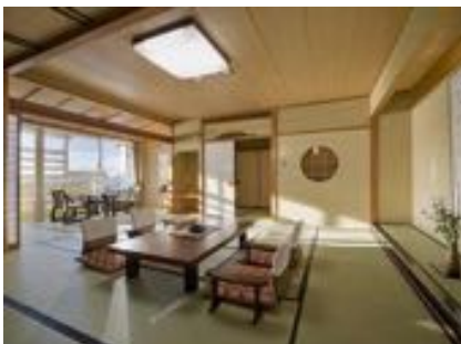
全室夕日向き「景湧閣」露天風呂付客室