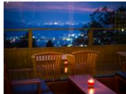
お部屋からの景色