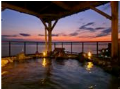
夕日の見える露天風呂