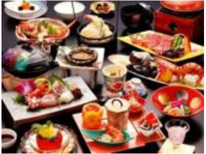
活鮑と牛を2つの陶板で