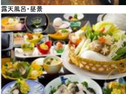
季節限定「とら河豚会席」