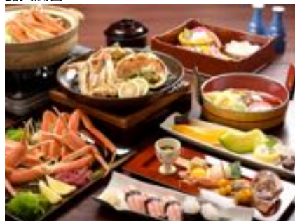
蟹三昧会席の一例