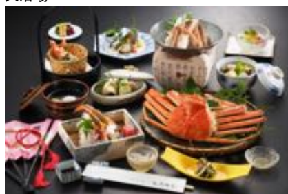
冬の味覚満載プラン料理例