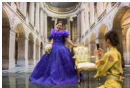
シンデレラに変身できる「写真館」