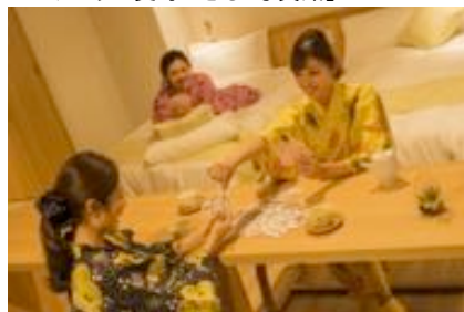
お部屋でつくるぐイメージ