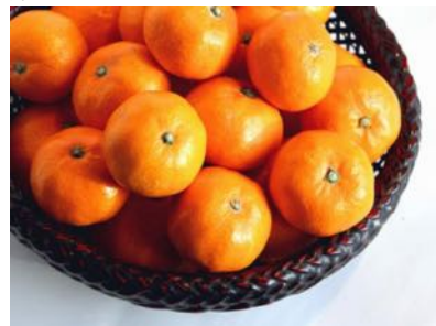
こたつでみかんイメージ