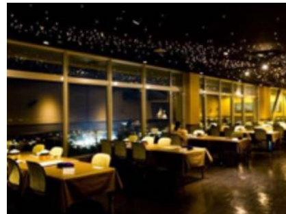
夜景の綺麗なレストラン

http://www.7.489ban.net/v4/client/plan/detail/customer/tennomaru/plan/116294