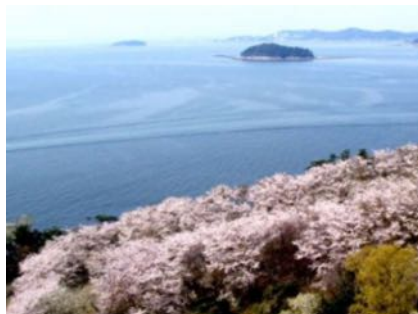
桜の穴場「西浦園地」へ徒歩2分