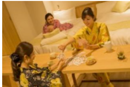
お部屋でつくるぐいイメージ