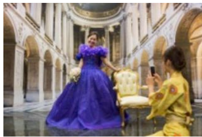
シンデレラに返信できる「写真館」