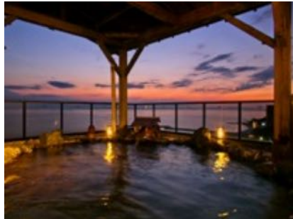
夕日の見える露天風呂

http://www.7.489ban.net/v4/client/plan/detail/customer/genji-koh/plan/19365