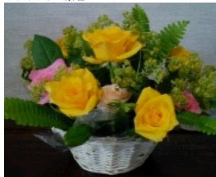
フラワーアレンジ