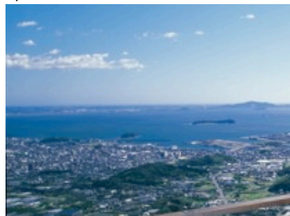
デッキからの景色

http://taikenplan.jp/program/detail.php?id=917