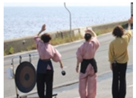
スタッフイメージ