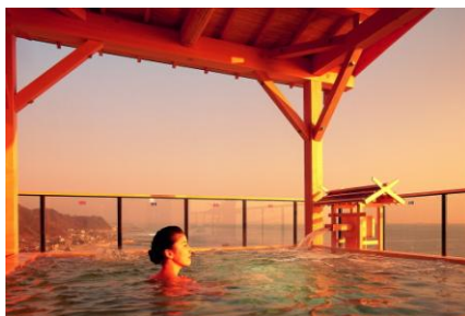
●源氏香/屋上露天風呂

観光庁は、観光立国の実現に向けて、国内外観光客の宿泊旅行回数・滞在日数の拡大を目指し、2泊3日以上の上質型観光を促進しています。海栄RYOKANSの宿がある地域では、観光圏整備実施計画に平成21年度の「伊勢志摩地域観光圏」につづき、22年度「知多半島観光圏」が認定されました。これを機会に、宿のある地域の周辺観光モデルコースを紹介するなど、観光資源の魅力を発信し宿泊旅行の促進となるプランを企画しました。